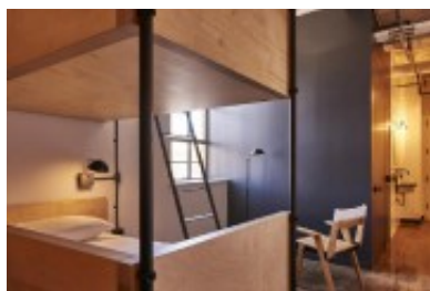
Chambre pour un groupe de quatre