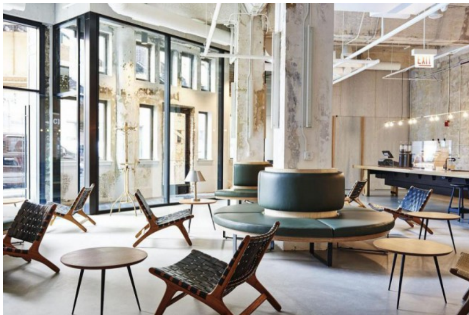
Hall de l'hôtel